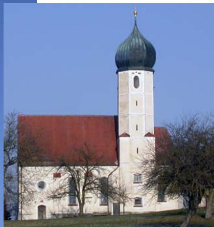
Kirche in Weiterskirchen