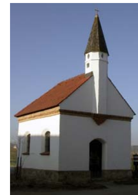
Kapelle in Großrohrsdorf

Die Schwedenkapelle und die Kapelle in Großrohrsdorf bereichern unsere Gemeinde.